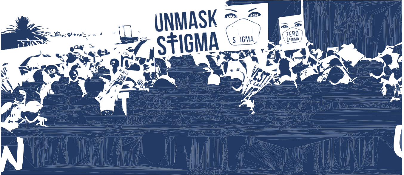
चित्र का श्रेय: उपचार कार्य अभियान के लिए डेविड हैरिसन द्वारा चित्रित