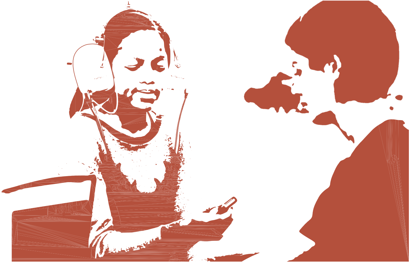
चित्र का श्रेय: KUDUwave™ पोर्टेबल ऑडियोमीटर